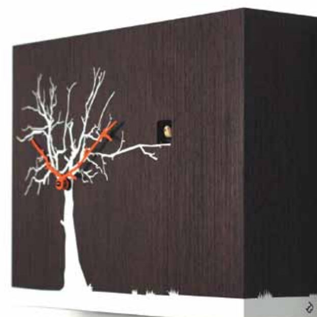
Progetti Carate Brianza, Milano - Italia | www.progettishop.it

COCORAKO Orologio a cura realizzato in legno, movimento al quarzo a batteria. Cuckoo clock made in wood, battery quartz movement. Design: Riccardo Paoloni e Matteo Fusi.