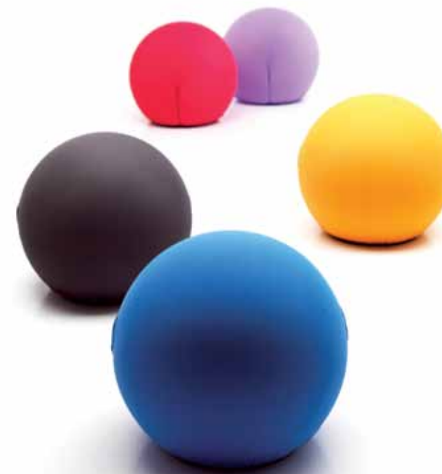
Cerruti Baleri Milano - Italia | www.cerrutibaleri.com

Tatino Seduta elastica e poggiatesta, realizzato in polipropilene flessibile ed ecologica con struttura interna anatomica. Sitting elastic or footrest, made of flexible polypropylene with internal structure and ecological anatomy. Design: Enrica Baleri e Denis Santachiara.