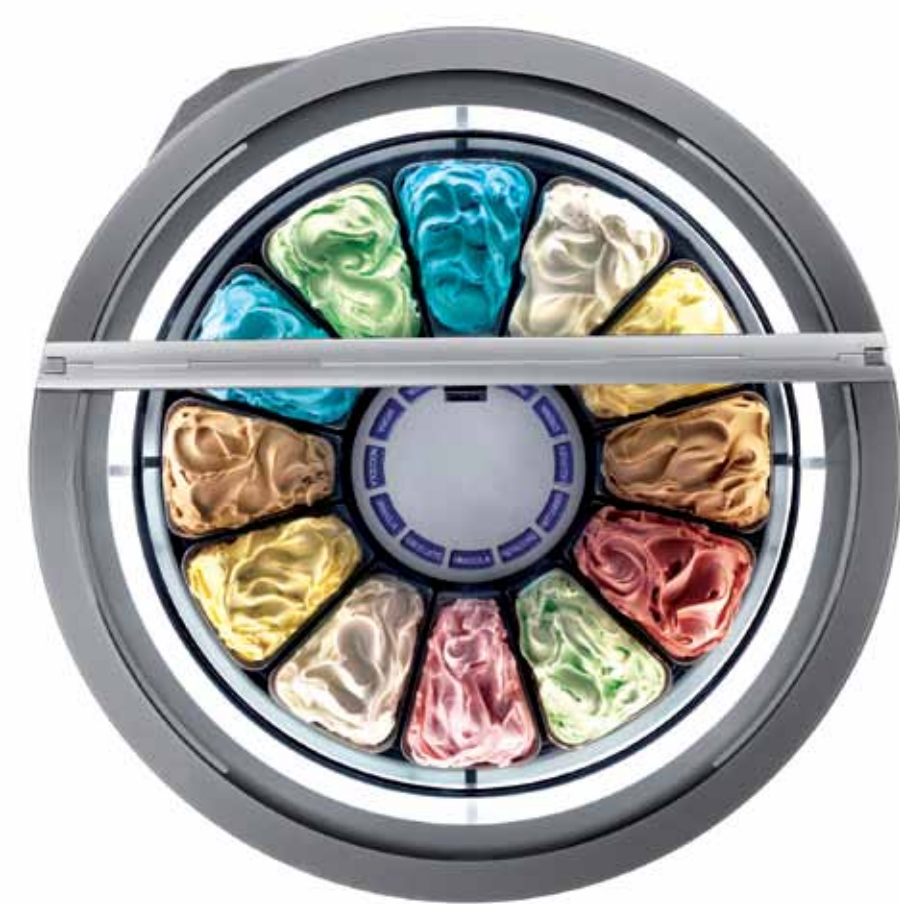
Ifi Tavullia, Pesaro - Italia | www.ifi.it

Tonda Vetrina per il gelato artigianale. Gelato display case. Design: Makio Husuike con Ufficio Tecnico Ifi.