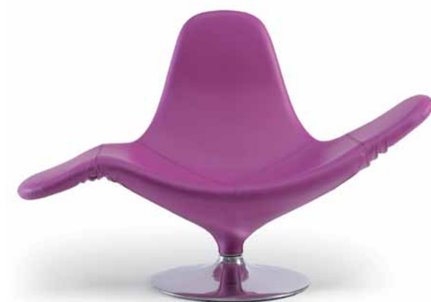
Domodinamica Osteria Grande, Bologna - Italia | www.zerozerodesign.it

Calla Poltroncina con telaio interno in acciaio con polipropilene schiumato a freddo in stampo e sovratta da una base girevole in lega di alluminio lucidato. Ha la possibilità di trasformarsi in chaise longue. Armchair in polypropylene resin cold foamed with iron structure inside, supported by a rotating base in polished aluminium alloy. Offers the possibility to be transformed in chaise longue. Design: Stefano Giovannoni.