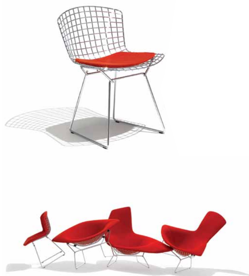
Knoll Milano - Italia | www.knoll-int.com

Bertoia Serie di sedute con struttura in tondino di acciaio cromato con cuscino rosso. Series of sessions with structure in rod-plated steel with red cushion. Design: Harry Bertoia.