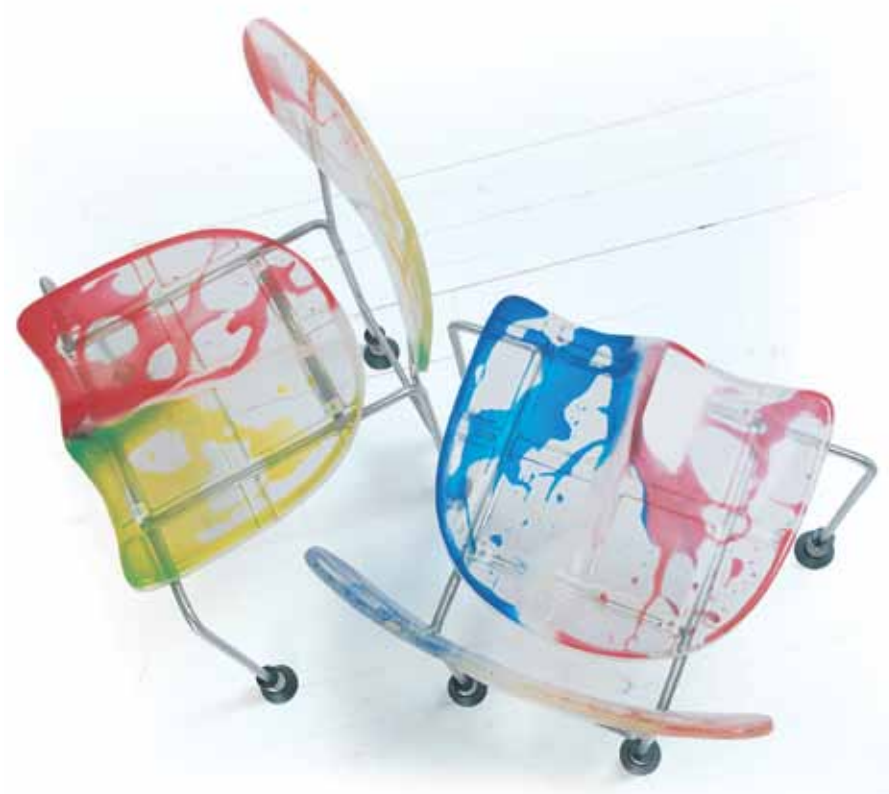
Bernini Cerfano Laghetto, Milano - Italia | www.bernini.it

543 Broadway Sedia in acciaio inox con seduta e schienale in nylon spugnoso e piedini a molle. Chair in stainless steel with seat and backrest in epoxy resin and spring feet. Design: Gaetano Pesce.