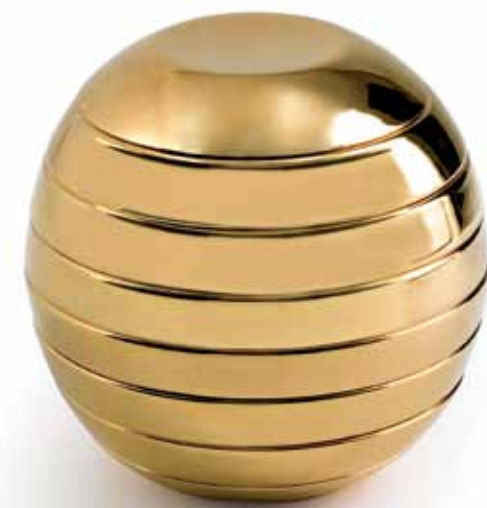
Bosa Borso del Grappa, Treviso - Italia | www.bosatrade.com

Giulietta e Romeo Set di piatti per 2 persone decorati a mano con metalli preziosi. Set of plates for 2 persons handdecorated with precious metals. Design: Riccardo Schweizer.