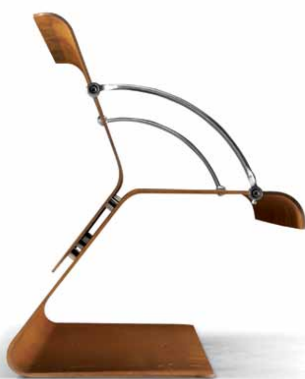
Metalco Castelmolino di Resana, Treviso - Italia | www.metalco.it

COCORAKO Orologio a cura realizzato in legno, movimento al quarzo a batteria. Cuckoo clock made in wood, battery quartz movement. Design: Riccardo Paoloni e Matteo Fusi.