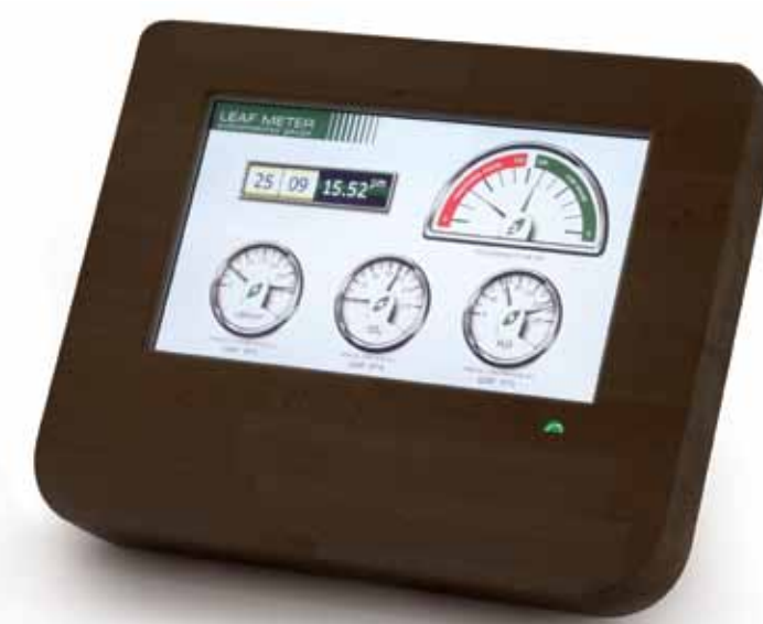
Loccioni Angeli di Rosora, Ancona - Italia | www.loccioni.com

Leafmeter Misuratore di sostenibilità. Sustainability gauge. Design: Giorgio Di Tullio.