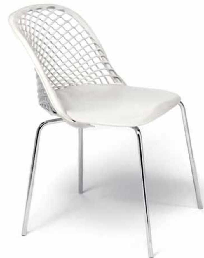
Matteograssi Mariano Comense, Como - Italia | www.matteograssi.it

Zoe Poltroncina in rete di cuoio con struttura in acciaio cromato. Small armchair in coach hide with patented cutting. Chrome steel structure. Design: Franco Pini.