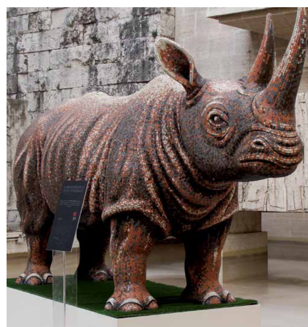
Stone Italiana Zimella, Verona - Italia | www.stoneitaliana.com

Rinoceronte Scultura RINOCERONTE rivestita in tessuto di mosaico artistico in quarzo. Artistic quartz mosaic tiles coated RINNO sculpture. Design: Michele Lavetto.