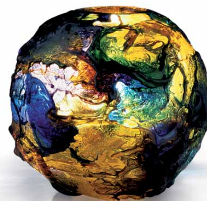
Venini Murano, Venezia - Italia | www.venini.com

Geocolore Vaso in vetro multicolore soffiato e lavorato a mano. Blown handworked vase made of coloured glass. Design: Gae Aulenti.